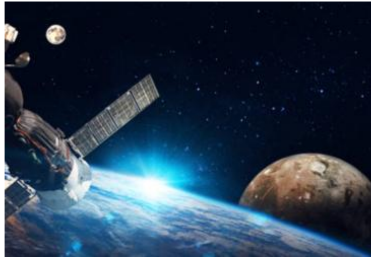
宇宙事業の地上実証