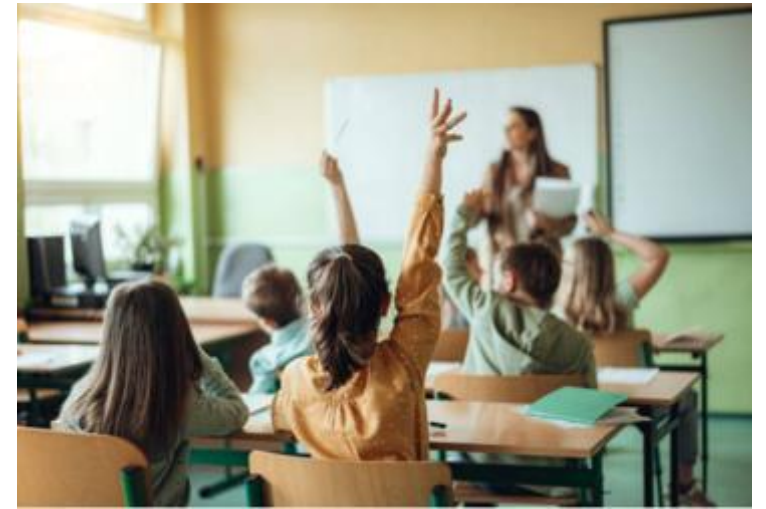
教育プラットフォーム