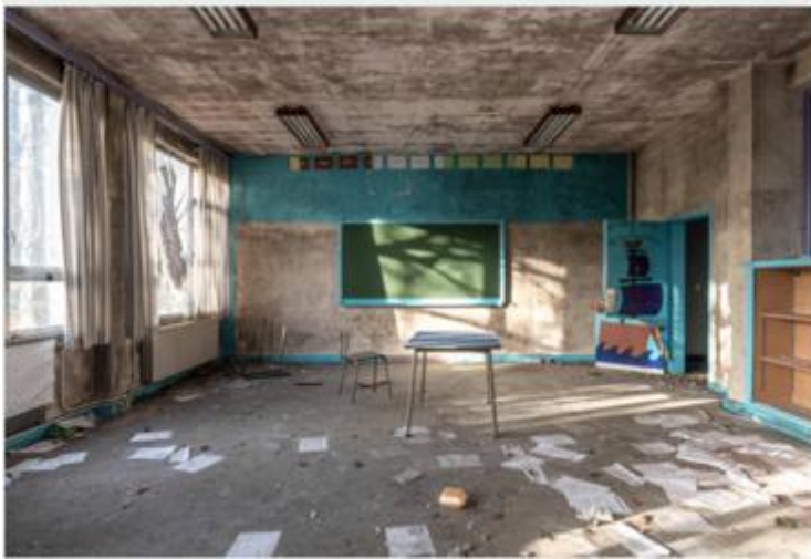
廃校の新たな活用方法